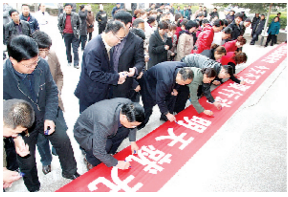
林州市肿瘤医院举行“抵制滥用药物大签名”活动

林州市肿瘤医院在千方百计提高食管癌防治水平的同时,也没有放松对职工的医德医风教育。他们坚持传统教育与建立长效机制相结合,建立全员职工医德医风考核制度和档案,所有从业人员自觉履行工作职责,恪尽职守,廉洁自律,其一言一行、一举一动都在患者和群众的监督之下。“依法行医,厚德精术”不仅成为工作规范,而且是每一位医务人员必须遵守的职业操守和行为规范。相信林州市肿瘤医院一定会成为更受患者和人民群众信赖的好医院!