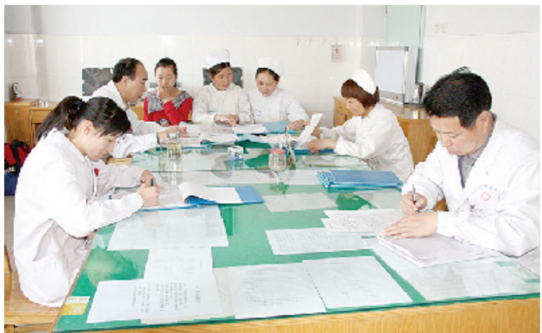
医德医风教育已经成为林州市肿瘤医院的必修课,图为临床科室每周进行的“廉洁行医”学习。

一家好的医院,不仅要具有精湛的医疗技术,更重要的是要有一支医德医风良好、具有较高素质的职工队伍。